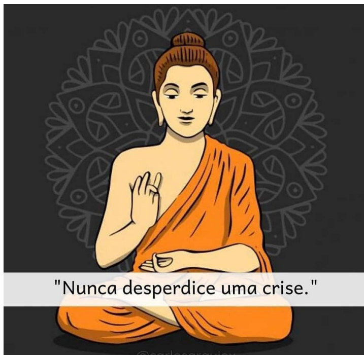
Figura 2 – “Nunca desperdice uma crise”

no ramo de “estética sistêmica integrativa”, “ciências neuropáticas”, com conteúdos relacionados a terapias corporais e tratamentos diversos para estética e bem-estar. Essa mesma postagem, no entanto, também aparece no Facebook nas páginas “Terra dos Budas” 55 e “Resiliência Humana”, 56 ainda com autoria atribuída a @carlosaraujox, mas desta vez com um texto que menciona a importância de assumir uma posição pessoal de bênção diante do ônus. Nos dois casos do Facebook, assim como na postagem de @drakatia, a frase “Nunca desperdice uma crise” permanece, mas na postagem da página “Resiliência Humana” a ilustração de Buda já não está presente.